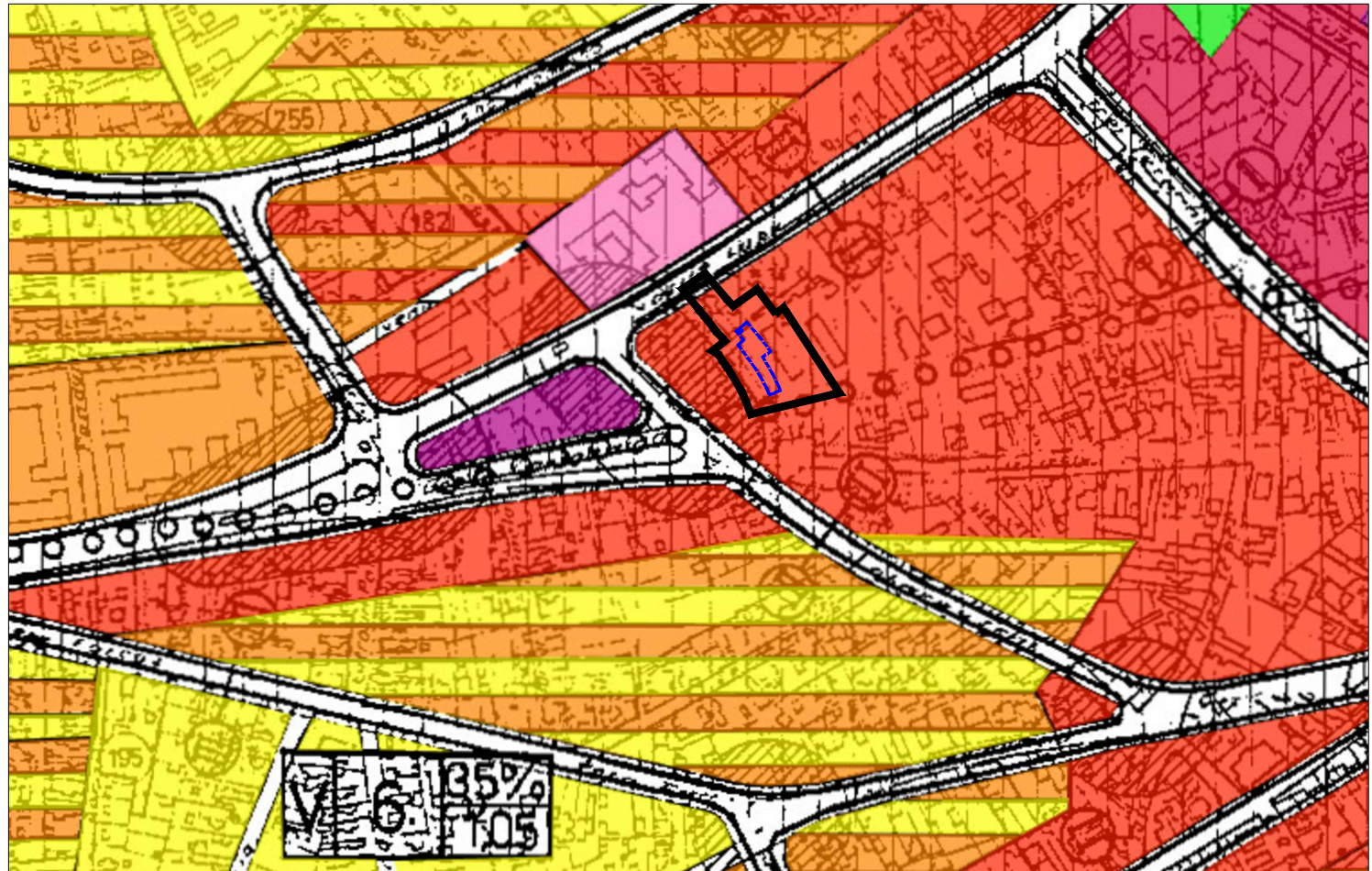
INCADRARE IN PUG 1:5000